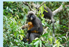
郁乌叶猴的特征就是它眼睛周围的一副亮白色‘眼镜’，可爱的外表一眼认得出它来。

逃离钢筋水泥城的喧嚣，在 18°C 至 26°C 的凉爽气温下与静谧的大自然心灵交接，放下都市生活繁忙的一切一切。静心沉淀在升旗山山峰上的微凉气候，呼吸着新鲜的空气，让自己身、心、灵都获得释放。