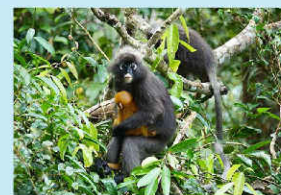
郁乌叶猴的特征就是它眼睛周围的一副亮白色‘眼镜’，可爱的外表一眼认得出来。

逃离钢筋水泥城的喧嚣，在 18°C 至 26°C 的凉爽气温下与静谧的大自然心灵交接，放下都市生活繁忙的一切一切。静心沉淀在升旗山山峰上的微凉气候，呼吸着新鲜的空气，让自己身、心、灵都获得释放。